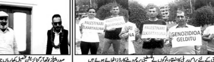
تین کے شرلوہ میں سائمن وپاکستانی کیونٹی کے ذریعہ اہتمام قسطنطین کے ساتھ اظہارِ رنجی کے لئے پان پان ایل اے تشدد کو روکنے کے لیے