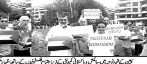
تین کے شرلوہ میں سائمن وپاکستانی کیونٹی کے ذریعہ اہتمام قسطنطین کے ساتھ اظہارِ رنجی کے لئے پان پان ایل اے تشدد کو روکنے کے لیے