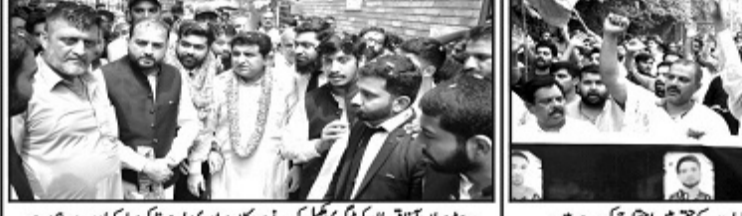
بھارت میں مسلمانوں کو تشدد کا نشانہ بنانے والے قادیانیوں کو روکنے کے لیے ایک احتجاجی جلسہ منعقد کیا گیا ہے۔

معاشرہ میں قبول (اقلیت کا درجہ) کر سکتے ہیں؟ ۲: ختم نبوت صلی اللہ علیہ وآلہ وسلم کے چور (قادیانی) کے ساتھ میڈیا طور پر دنیادی مراسم کی جگہ جاری رکھتے ہیں؟ ۳: صدقہ حقیقت ہے، قادیانی دین کے ختم اور مسلمانوں کے ایمان دشمن ہیں اس کے باوجود حکومت ریاستی ادارے اور سول سوسائٹی کا لہجے اور یونیورسٹیز کی سطح پر نوجوان نسل کو قادیانی فتنہ کا آکر بننے سے کیوں روک نہیں سکتے ہیں؟ ۴: قادیانی ظاہری طور پر تبلیغ دین کی کرتے ہیں لبرل نوجوانوں کے سامنے خود کو مسلمان کہتے اور برائیوں سے