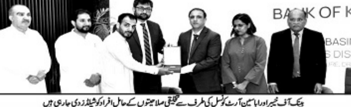
بینک آف نیچر ایسوسی ایشن آرٹ کونسل کی طرف سے تحقیقی ملا جیوں کے حامل افراد کو شیلڈ زدی جاری ہیں

خواتین پر کسی قسم کا دباؤ گزیرا بدولت نہیں کیا جائیگا، ہمیں اپنے معاشرے کی سوچ کو تبدیل کرنا پڑے گا