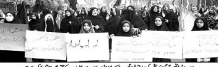
امامین سٹوڈنٹس آرگنائزیشن کے ممبران اور دیگر اہل علم کے ساتھ مل کر ایک احتجاجی جلسہ منعقد کیا گیا ہے۔

نوجوان نسل کا تقابلی اداروں کی سطح پر ڈیٹا اکٹھا کیا جائے۔ اس کے ساتھ ساتھ رابطہ سازی، ذہن سازی اور قادیانی فتنہ کی سازشیں سمجھنے کی حقیقت آشکار کرنے کے بنیادی اقدامات اٹھائیں جائیں۔ ہر مسجد کا امام اپنے ذاتی تعلق کو استعمال کرے اور یونیورسٹیز میں ختم نبوت سیمینارز کی بدولت نوجوان نسل کی تربیت سازی کی ترویج جاسکے۔