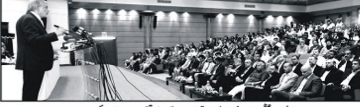
ڈینی ڈیرا محترم اور وزیر خزانہ اسحاق ڈار اسلام آباد میں تقریب سے خطاب کر رہے ہیں

سوشل میڈیا پلیٹ فارمز اشتہارات چلاتے ہیں ٹیکس نہیں دیتے، چیئر مین پی ٹی اے حقیقت ہے یہاں کوئی ٹیکس نہیں دینا چاہتا، ایسے پلیٹ فارمز بند کر دیں، موبائل فون کو سستا کیا جائے، قاروق ایچ ٹی اے 100 روپے کے کارڈ پر 34.50 فیصد ٹیکس، سری لنکا میں یہ 20 فیصد اور بھارت میں 18.5 فیصد ہے، چیئر مین کبھی اسلام آباد (آن لائن) وفاقی وزیر جماعت کو سبھت کی کارکنوں کو بھرتے ہوئے کہا کہ ٹیکس (ٹیکس) پر برائے قانون و انصاف پتھر پتھر ہٹانے کی بجائے حکومت کی پالیسی کا نیکو جائزہ پانڈی رقرار ہے (باقی صفحہ 4 پیج نمبر 3)